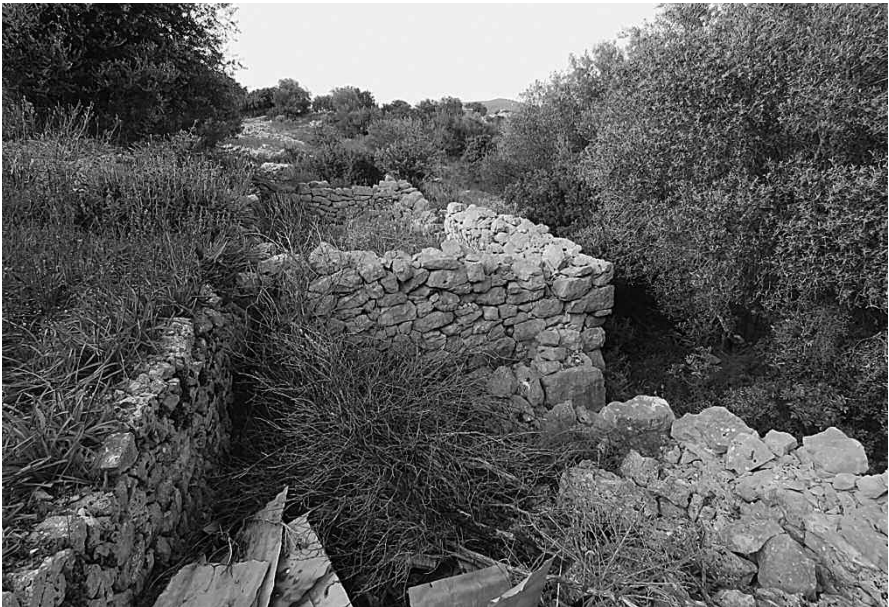
Εικ. 3: Ερείπια σύνθετου μακρυναριού.