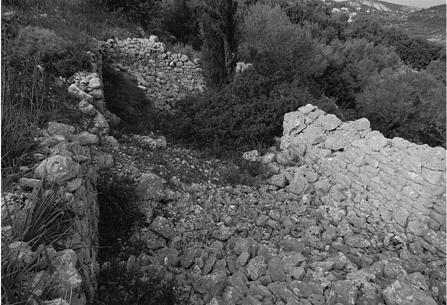
Εικ. 2: Ερείπια ανεξάρτητου μακρυναριού ενιαίου χώρου.