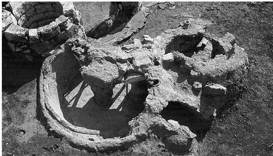
Εικ. 1. Δίδυμοι κλίβανοι από τον Κεραμικό.