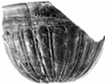
Εικ. 6. Τμήμα σκύφου (Z 17258) με συνεχόμενα πέταλα και ιωνικό κυμάτιο.