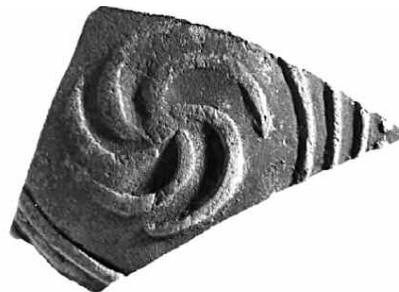
Εικ. 9. Όστρακο (Ευ. 19404) με διακόσμηση μακεδονικής ασπίδας.