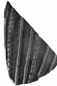
Εικ. 7. Όστρακο (Z 16987) με ανεξάρτητα πέταλα και κάθετες σειρές στιγμών ανάμεσά τους.