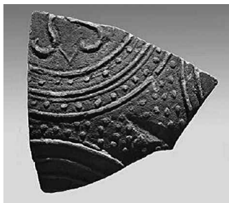
Εικ. 8. Ενυπόγραφο όστρακο (M 15057) με μακεδονική ασπίδα.