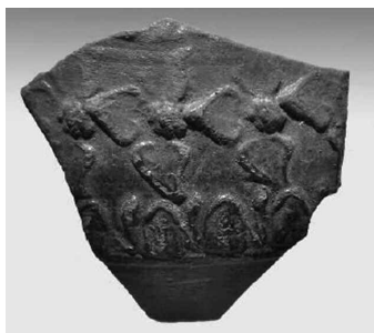
Εικ. 12. Τμήμα αγγείου (M 14452) με διακόσμηση κισσού.