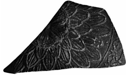
Εικ. 5. Όστρακο (M 14451) με φολίδες στον κάλυκα και τετραγωνισμένους ρόδακες κάτω από το χείλος.