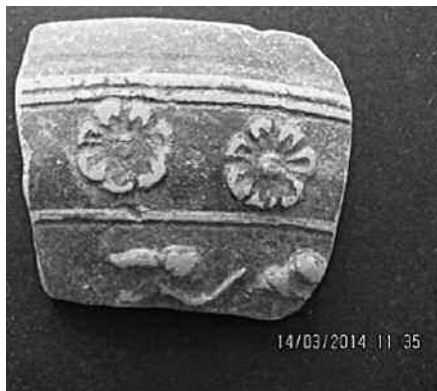
Εικ. 2. Όστρακο (Δ 13816) με αποσπασματικά σωζόμενα παράσταση Νίκης ημιόχου.