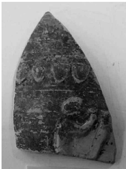
Εικ. 3. Όστρακο (Μ 19067) με παράσταση σατύρου.