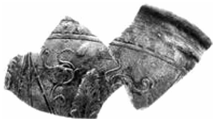
Εικ. 10. Όστρακο (Z 17106) με ελικοειδείς βλαστούς.