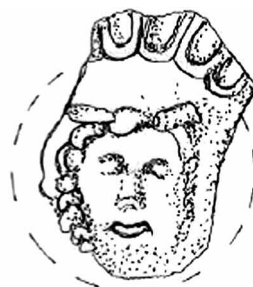
Εικ. 13. Σχέδιο τμήματος αγγείου (Μαζ. 19061) με μέταλλιο του τύπου των Ωραίων Μεδουσών.