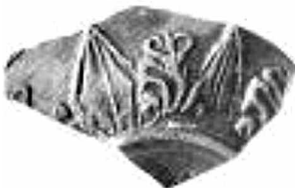
Εικ. 11. Όστρακο (Z 17100) με διακόσμηση ρομβόσχημων και λογχόσχημων φύλλων εναλλάξ με ανθέμιο.