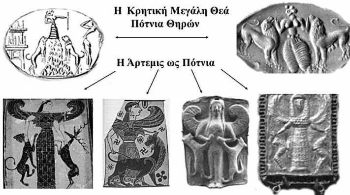
Εικ. 4. Άνω: μινωικοί σφραγιδολίθοι με παραστάσεις Πότνιας Θηρών. Κάτω: η Άρτεμις σε στάση Ποτνίας από αρχαϊκά αγγεία, ανάγλυφο και χρυσό κόσμημα από τη Ρόδο.

ελληνικές αναφορές έχουν καθορίσει μέχρι τις τελευταίες προεκτάσεις τους τη μεταγενέστερη θρησκευτική εξέλιξη, θα ήταν αντίθετο με τη θρησκευτικότητα των Ελλήνων να απορρίψουν τη σύγκλιση και τη συμφωνία αφ' ενός μεν της Άρτέμιδος, που κληρονόμησε την Κυρία των Μελισσών, αφ' ετέρου δε του κοινωνικού και οργανωτικού ρόλου, που ασκούσαν με τελετουργική αγνότητα τα μέλη της ιερατικής ιεραρχίας γνωστής με τον επίσημο τίτλο Έσσηνες. Πίστευαν ότι η μέλισσα γεννιέται μέσα από τη γη, όπως τα τζιτζίκια και άλλα χθόνια έντομα, ή μέσα από το πτώμα ενός βοοειδούς. Χαρακτηρίζεται «βουγενής» 39 όπως και ο Διόνυσος-Ζαγρέας. Αυτόν οι Τιτάνες τον κατασπάραξαν μεταμορφωμένο σε ταύρο, από τα σπαράγματα του οποίου αναγεννήθηκε ως νέος Διόνυσος, γιος της Σεμέλης.