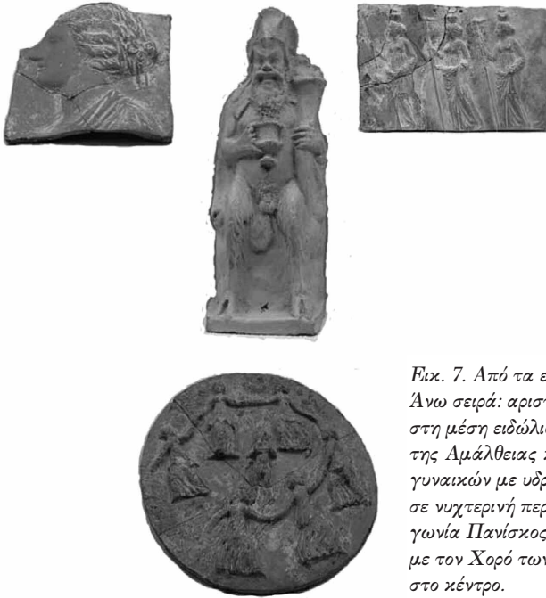
Εικ. 7. Από τα ευρήματα της Μελισσάνης. Άνω σειρά: αριστερά κεφαλή Νύμφης, στη μέση ειδώλιο του Πάνα με το κέρασ της Αμάλθειας και δεξιά ακολουθία γυναικών με υδρίες στο κεφάλι και δάδες σε νυχτερινή περιπλάνηση. Στην αριστερή γωνία Πανίσκος. Κάτω: ο πήλινος δίσκος με τον Χορό των Νυμφών και Πανίσκο στο κέντρο.

νό, που είχε συσσωρευθεί από τα περιττώματα των νυχτερίδων του σπηλαίου (εικ. 7).