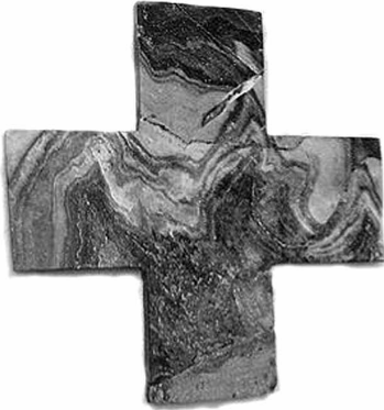
Εικ. 12. Ο μαρμάρινος ισοσκελής σταυρός από το ιερό θησαυροφυλάκιο της Κνωσού (internet).

δύο ισοσκελείς σταυροί σε μήτρες από τη Σητεία (Κρήτη), ο ένας πάνω από μηνίσκο της σελήνης και ο άλλος μέσα σε οδοντωτή περιφέρεια. γ) Συχνά ει- κονίζεται σταυρός εγγεγραμμένος μέσα σε κύκλο και σε αγγεία από το ανά- κτορο της Κνωσού. δ) Με τη μορφή σβάστικας σε σφραγίδες από το ιερό θη- σαυροφυλάκιο Κνωσού πάνω από κερασφόρο πρόβατο και μεταξύ των κερά- των κεφαλής βοός και ε) ένας χρυσός σταυρός από τον τρίτο βασιλικό τάφο των Μυκηνών. Η σημασία του ως λατρευτικού, αστρικού ίσως, συμβόλου προελληνικής θεότητας θεωρείται βέβαιη.