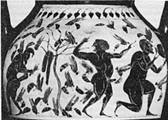
Εικ. 11. Σκηνή κλοπής μελιού. Οι κλέφτες καταδιώκονται από τις μέλισσες-τιμωρούς. (Μελανόμορφος αμφορέας του 540-520 π.Χ. Μουσείο Βασιλείας Ελβετία). Internet

Ανάλογη σχέση ανιχνεύουμε και σε μία περίεργη παράδοση από τα Κύθηρα, τα οποία υπήρξαν αποικία Κρητών περισσότερο από 3.000 χρόνια πριν 66 . Εκεί υπάρχει Ναός της Θεοτόκου με την προσωνομία Κακή Μέλισσα 67 . Σύμφωνα με την παράδοση αυτή, όταν πειρατές επιτέθηκαν στη μονή, οι καλόγριες κλείστηκαν στην εκκλησία και προσεύχονταν γονυκλινείς. Οι επιδρομείς άρχισαν να χτυπούν με τσεκούρια τις πόρτες της εκκλησίας. Τότε ακούστηκε μία φωνή, που φώναξε ελληνικά «κακή μέλισσα», και σμάρι τα έντομα όρμησαν εναντίον των πειρατών, που τράπηκαν σε φυγή (βλ. και εικ. 11). Ο ρόλος των τιμωρών μελισσών στα Κύθηρα, όπως στο αντίστοιχο σπήλαιο του Δία στην Κρήτη 68 και στην περίπτωση του Αγχίση, η σύνδεσή τους με τις καλόγριες και τα μοναστήρια (Κύθηρα, Αργίνια, Μελισσάνη), αλλά και η εξακριβωμένη σχέση των Κυθέρων με τη μινωική Κρήτη, υποδηλώνουν την επιβίωση στοιχείων μινωικής λατρείας στη θρησκευτική συνείδηση του λαού των δύο νησιών, Κυθέρων και Κεφαλονιάς.