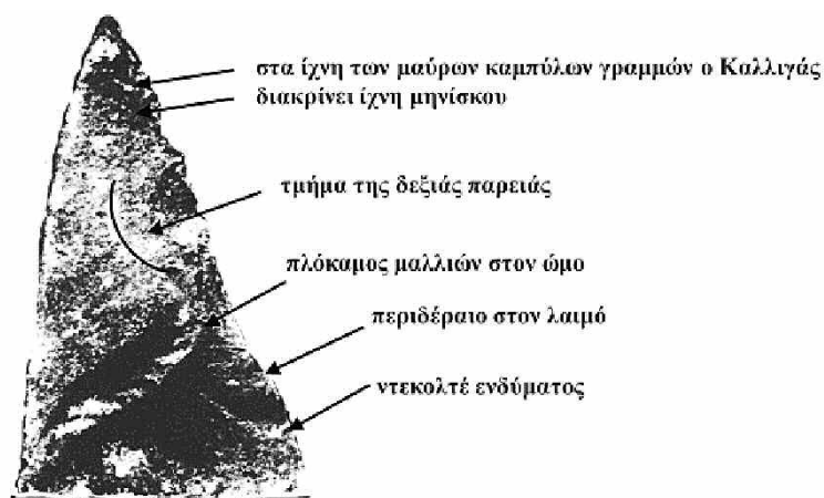
Εικ. 8. Το υπ' αρ. 1806 πλακίδιο από τη Μελισσάνη

αριθ. 1806, που βρίσκεται στο Αρχαιολογικό Μουσείο Αργοστολίου. Το εύρημα αυτό, αν και αρκετά φθαρμένο, απεικονίζει μία κατ' ενώπιον γυναικεία μορφή, την οποία οι μεν Μαρινάτος και Δοντάς δεν ταυτίζουν με καμία θεότητα, αλλά ο Καλλιγάς 44 θεωρεί ότι ίσως είναι η Άρτεμις (εικ. 8), διότι διακρίνει ίχνη μηνίσκου στο κεφάλι, χαρακτηριστικό της θεάς υπό την ιδιότητά της ως Σελήνης. Θεωρούμε σημαντική την άποψη του Καλλιγά, γιατί η Άρτεμις, όπως προαναφέραμε, είναι διάδοχη μορφή της κρητικής Ποτνίας (βλ. εικ. 4). Ταυτίστηκε αργότερα με τη Σελήνη στον Ουρανό και με την Εκάτη στον Κάτω Κόσμο 45 .