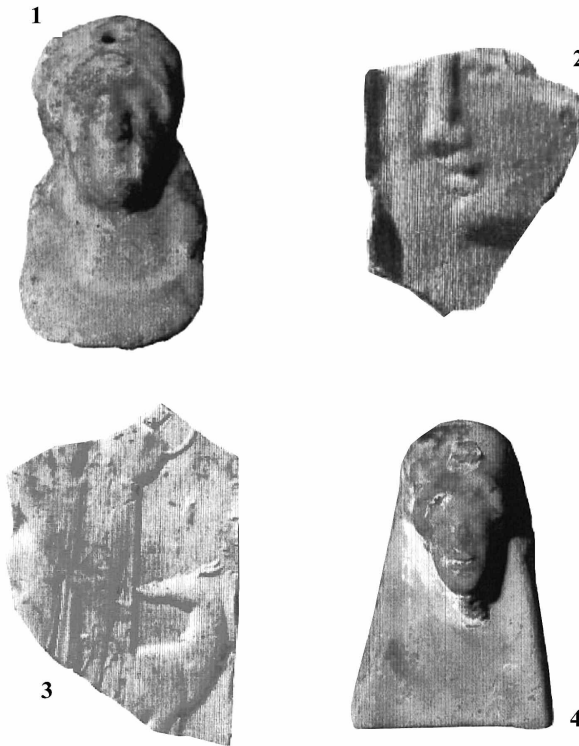
Εικ. 10. Από τα πήλινα ευρήματα της Δρακοσπηλιάς: 1 και 4: μικρές γυναικείες προτομές. Η οπή στο άνω μέρος σημαίνει ανάρτηση. 2: τμήμα πλακιδίου με μορφή προφίλ. 3: τμήμα πλακιδίου με την Άρτεμη, τον Απόλλωνα κιθαρωδό και ελάφι. (STAVROULA SAMARTZIDOU-ORKOPOULOU, ό.π.)

(=νύμφες, νεράιδες), που προστάτευε την περιοχή από κάθε κακό και συμβίωναν φιλικά με τις γυναίκες του νησιού».