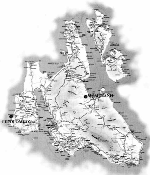
Εικ. 9. Με τις κουκίδες σημειώνονται οι θέσεις των δύο σπηλαίων σε εκ διαμέτρου αντίθετα σημεία της Κεφαλονιάς.

λονιά ήταν Τετράπολις και υπήρχαν σύνορα μεταξύ των τεσσάρων κρατών-πόλεων, τείχη και ακροπόλεις. Προσανατολιζόμαστε, λοιπόν, στο συμπέρασμα ότι η λατρεία της Ἀρτέμιδος υπερέβαινε τα σύνορα αυτά, ήταν κοινή και προϋπήρχε του διαχωρισμού σε τέσσερα κράτη. Αυτό συνάδει με τη μαρτυρία του Ηρακλείδη του Ποντικού για τη λατρεία της Λαφρίας Ἀρτέμιδος 47 από τους κατοίκους. Δεν τους ονομάζει με τα διαφορετικά εθνικά των τεσσάρων πόλεων, αλλά τους αναφέρει γενικά ως Κεφαλλῆνες, παρ' ὅλο που στη δική του εποχή (4ος αι. π.Χ.) οι κάτοικοι είναι ἤδη γνωστοί από τον Θουκυδίδη (5ος π.Χ. αι.) ως Παλῆς, Κράνιοι, Σαμαῖοι, Προναῖοι και παρ' ὅλο που στα σωζόμενα νομίσματα της αυτής εποχής αναγράφονται τα διαφορετικά ονόματα των πόλεων.