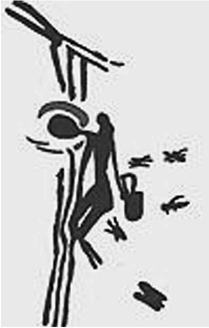
Εικ. 2. Συλλογή μελιού. Σπηλαιογραφία στη Μπικρόπ. Ισπανία πριν από 15.000 χρόνια. (Φωτ. Internet).

Η μέλισσα υπάρχει από εδώ και εκατομμύρια χρόνια (εικ. 2). Τα δώρα, που δίνει στους ανθρώπους κατευθείαν από τη φύση, το μέλι και το κερι, η εργατικότητα της, η θαυμαστή της οργάνωση με την αυστηρή ιεραρχία και τη μητριαρχικά οργανωμένη κοινωνία της, που θυμίζει την κοινωνία της μινωικής Κρήτης, την κατέταξαν μεταξύ των ιερών ζώων 18 . Η παραγωγική της δραστηριότητα τη διαφοροποιεί από τον τζίτζικα, την πεταλούδα και τα άλλα έντομα, όπως οι σφήκες και ιδίως τα μυρμήγκια, τα οποία είναι μεν οργανωμένα σε κοινωνίες, αλλά δεν παράγουν και δεν προσφέρουν στους ανθρώπους. Γι' αυτό και έχει επιβληθεί ως σύμβολο, που διεγείρει τη σκέψη και την πράξη. Οι αρχαίες κυψέλες και οι θολωτοί τάφοι έχουν το σχήμα του σώματος της μέλισσας. Η συνεχής φροντίδα της κυψέλης, η ανατροφή και η διατροφή των νυμφών στα κελιά της κερήθρας, το καθημερινό της έργο γενικά παρομοιάζεται με την καθημερινή φροντίδα του σπιτιού, έργο, που προσιδιάζει στη γυναίκα φύση. Έτσι η μέλισσα ταυτίζεται με τη γυναίκα και θεωρείται σύμβολο γονιμότητας και αφθονίας.