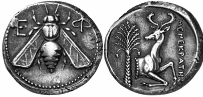
Εικ. 3. Αργυρό τετράδραχμο από την Έφεσο, που συνδέεται με τη λατρεία της Άρτέμιδος και τις ιέρειες Μέλισσες. Στην άλλη όψη απεικονίζονται: το ελάφι, σύμβολο της θεάς, και ο φοίνικας, κάτω από τον οποίο η Θέτις σύμφωνα με την παράδοση γέννησε την Άρτεμη και τον Απόλλωνα.

Ο Πausανίας 37 μας πληροφορεί ότι μεταξύ Ορχομενού και Μαντινείας υπήρχε ιερό της Ύμνιας Άρτέμιδος. Τη θεά υπηρετούσαν εκλεγμένοι από τους Μαντινείς και εφ' όρου ζωής ένας ιερέας και μία ιέρεια, που περνούσαν όλη τους τη ζωή σε μία θρησκευτική καθαρότητα με πολλές απαγορεύσεις και περιορισμούς. Τους περιορισμούς αυτούς, αλλά μόνο για ένα χρόνο, τηρούσαν και οι Εφέσιοι, που γίνονταν εστιάτορες της θεάς και ονομάζονταν από τους Εφεσίους Έσσηνες (τούς τῆ Άρτέμιδι ἰστιάτορας τῆ ἐφεσία γινομένους, καλουμένους δε ὑπό τῶν πολιτῶν ἐσσηνας). Οι Έσσηνες, λοιπόν, της Άρτέμιδος είχαν υπό την επίβλεψή τους τις ιέρειες Μέλισσες. Στην αλεξανδρινή ποίηση ο Έσσην, όνομα άγνωστης ετυμολογίας, αναφέρεται ως συνώνυμο του βασιλεύς και ήγεμών. Σημαίνει την αρχηγό της κυψέλης, που θεωρούσαν «βασιλιά» και όχι «βασιλισσα». Η περιγραφή αυτή του Πausανία, καθώς και άλλες αναφορές του 4ου π.Χ. αι. μας δίνουν τα κύρια χαρακτηριστικά του λειτουργήματος της έσσηνίας, που ασκούσαν οι ιερείς της Άρτέμιδος.