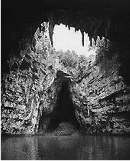
Εικ. 1. Το λιμνοσπήλαιο Μελισσάνη με το νησάκι των ανασκαφών στο βάθος.

προϊστορίας του νησιού. Με την παρούσα θα επιχειρήσουμε να προσεγγίσουμε το λιμνοσπήλαιο Μελισσάνη και να ανιχνεύσουμε τον λατρευτικό του ρόλο κατά τη μακρινή αρχαιότητα. Εκτός των ανωτέρω ένα επί πλέον ερέθισμα για την έρευνά μας αυτή αποτέλεσε και το ακόλουθο σχόλιο του Ηλία Τσιτσέλη: «Περίεργος ή πρόταξις τοῦ Ἁγιά, ὡς καὶ εἰς ἄλλας λέξεις, καίτοι μὴ ὀνόματα ἁγίων, ὡς Ἄις Μηλιανός, Ἁγία Μελισσάνη κ.λπ.» 2 .