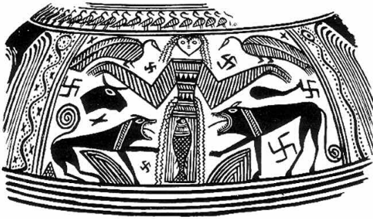
Εικ. 6. Βοιωτικός γεωμετρικός αμφορέας με απεικόνιση Ποτνίας Θηρών. (N. Παπαχατζής: Πausανίου Ελλάδος Περιήγησις, Βοιωτικά, σ. 52, εικ. 40).

χθονίων και των ουρανίων στοιχείων, από τα οποία αυτή γονιμοποιείται και γεννά 42 . Τις ιδιότητες αυτές τις μοιράζονται αργότερα, όπως προαναφέραμε, η Άρτεμις και η Δήμητρα, μεταλλαγμένες μορφές της πρωταρχικής θεάς.