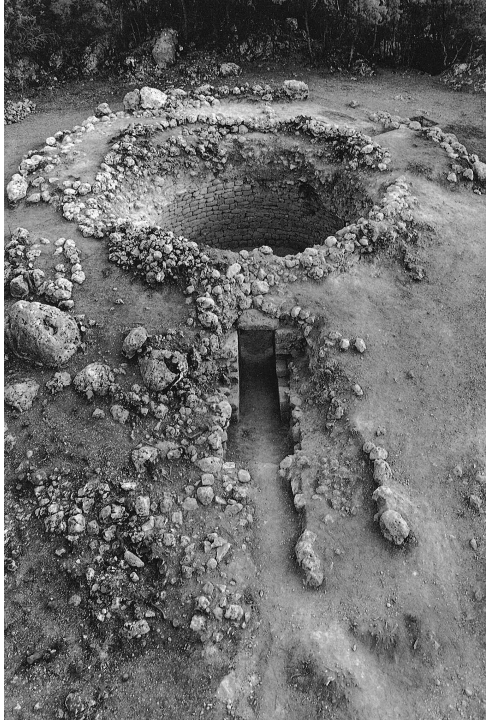
Εικ. 8. Ο θολωτός τάφος στα Τζαννάτα Πόρου Κεφαλονιάς