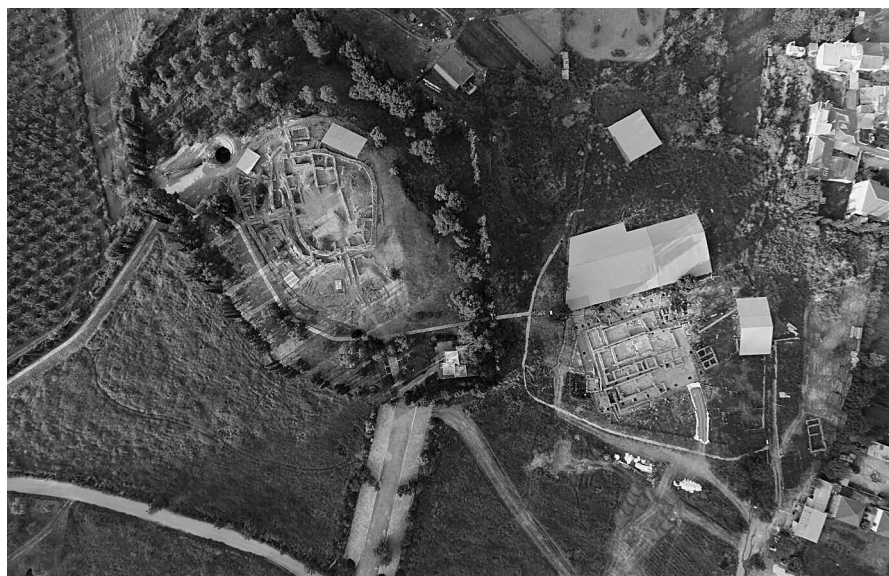
Εικ. 7. Αεροφωτογραφία του νεολιθικού και του μυκηναϊκού οικισμού του Διμηγίου