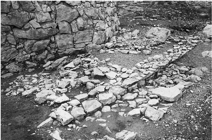
Εικ. 2. Θεμέλια τοίχων πρωτοελλαδικής κατοικίας οικισμού που εισχωρούν κάτω από τον βόρειο πύργο της μυκηναϊκής ακρόπολης του Τείχους Δυμαίων