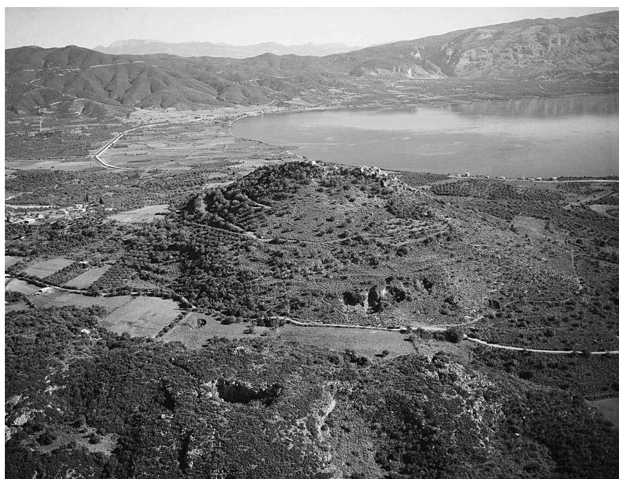
Εικ. 4. Αεροφωτογραφία του λόφου του Αγίου Ηλία (Ιθωρία) στον μυλό του Αιτωλικού κόλπου