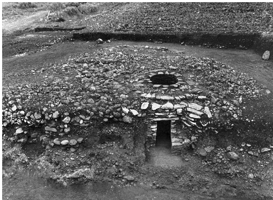
Εικ. 6. Λουτράκι Κατούνας. Θολωτός τάφος θεμελιωμένος στο κέντρο πρωτοελλαδικού τύμβου