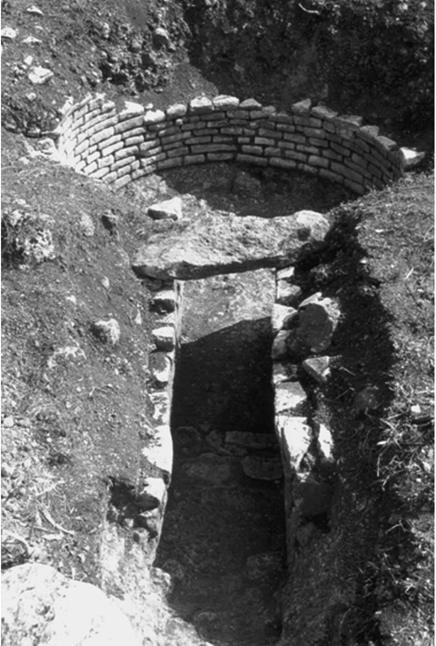
Εικ. 5. Θολωτός τάφος από τον Άγιο Ηλία (Ιθωρία) Αιτωλίας