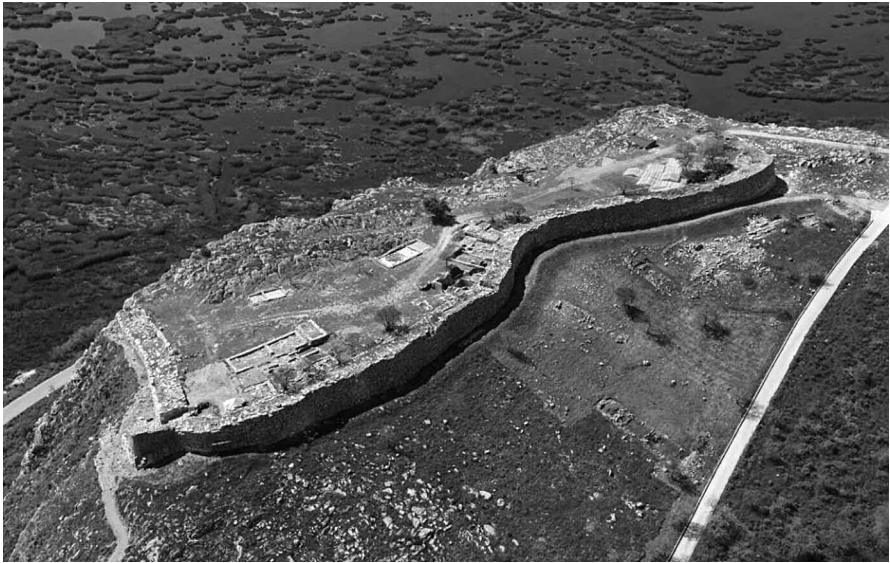
Εικ. 1. Αεροφωτογραφία του Τείχους Δυμαίων μετά τις εργασίες ανάδειξης